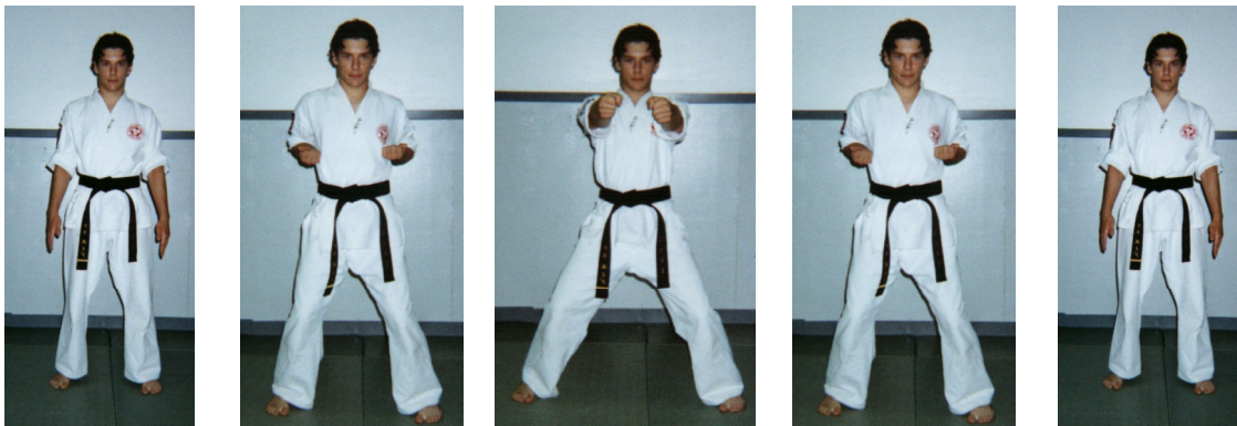
Shomen Tzuki décomposé (Coup de poing de démonstration alterné)