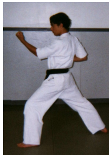
Shomen Tzuki Double (Coup de poing de démonstration double)